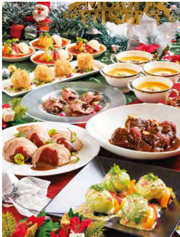
※写真は大人料理です。